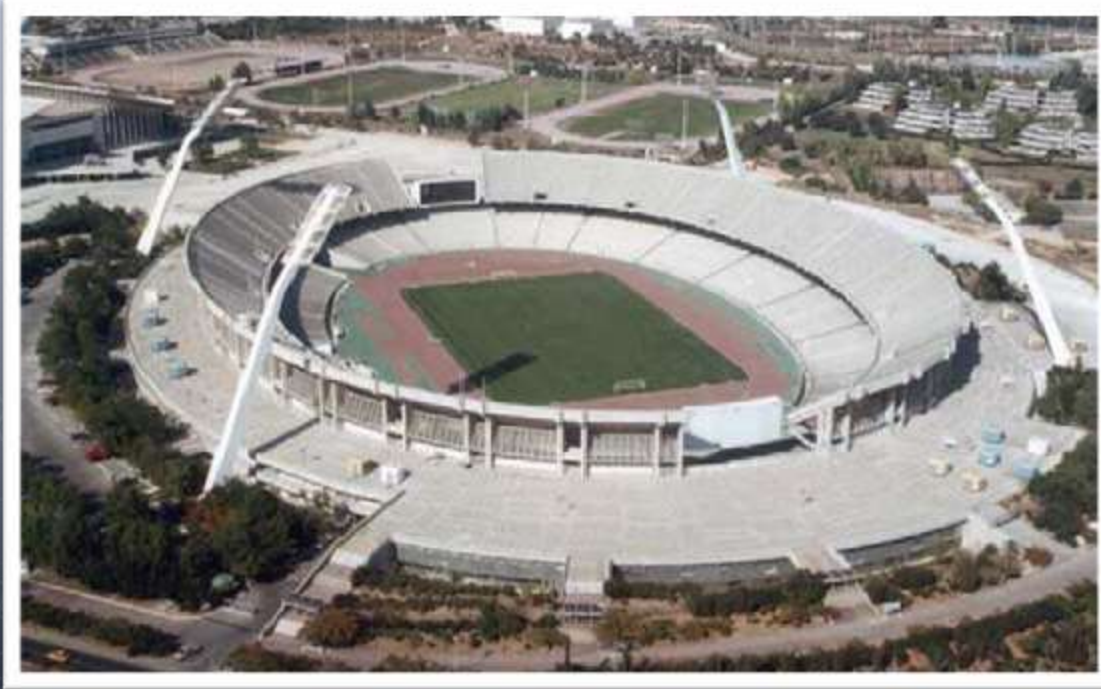
Στάδιο ΟΑΚΑ «Σπύρος Λούης» Olympic Athletic Center of Athens "Spiros Louis"