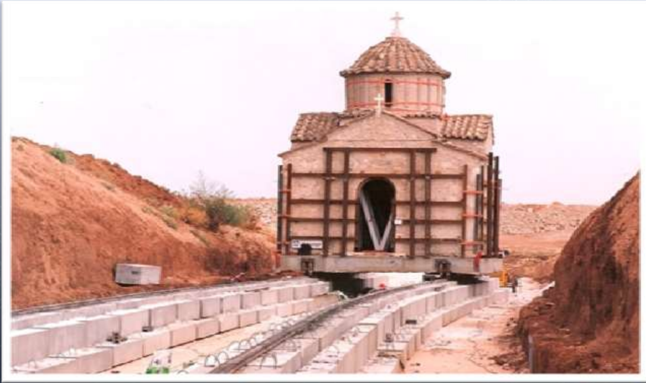
Μετακίνηση εκκλησίας στο Αεροδρόμιο Σπάτων Byzantine Church relocation, new Athens Int. Airport