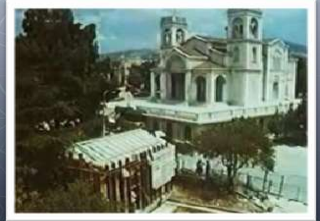
Μετακίνηση εκκλησίας στην Κηφισιά Chapel relocation at Kifissia