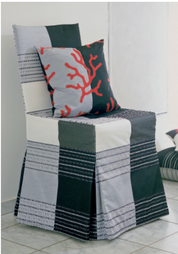
Εικ. 1. Σχέδιο του Alfred Apelt GmbH (www.apeltstoffe.de)