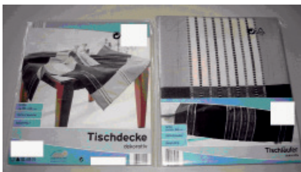
Εικ. 2. Το αντίγραφο που κατασχέθηκε από την επιχείρηση που διέθετε τα προϊόντα σε μειωμένες τιμές