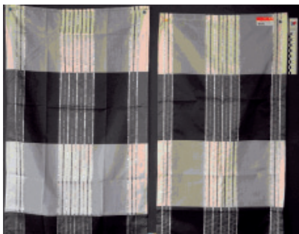
Εικ. 3. Αντίγραφο Αυθεντικό

Photos: Alfred Apelt GmbH, Courtesy of "Verband der Deutschen Heimtextilien-Industrie e.V.", 2009.