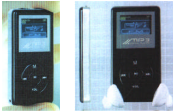
MP3 PROMOCIÓN DEL DIARIO AS

c) El reproductor de MP3 ofertado se acompaña como pieza num 1 por DIARIO AS y doc num 31 a 33 de la actora, adquiridos a MOSAICO LOGISTICS & SUPPLY CHAIN CONSULTING, S.L, que a su vez los importa de China (hecho admitido y doc num 26 y 28), aclarándose por el perito de la parte actora que no varía sus conclusiones (elaboradas sobre esas fotografías) tomando en consideración la muestra física, en tanto que el perito de las demandadas manifiesta que la única salvedad de la reproducción fotográfica respecto de la muestra física es la referente a los tornillos pequeños que aparecen en el lateral, que no se aprecian en la fotografía.